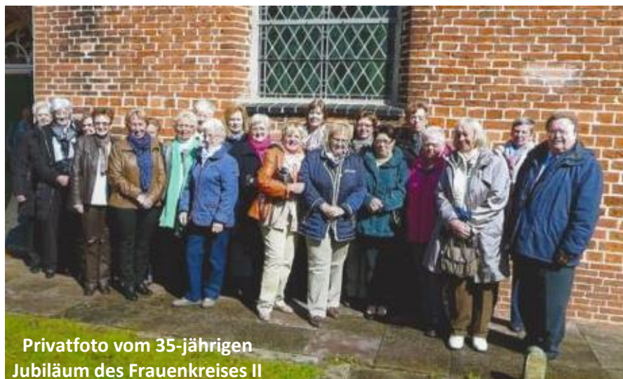
Privatfoto vom 35-jährigen Jubiläum des Frauenkreises II